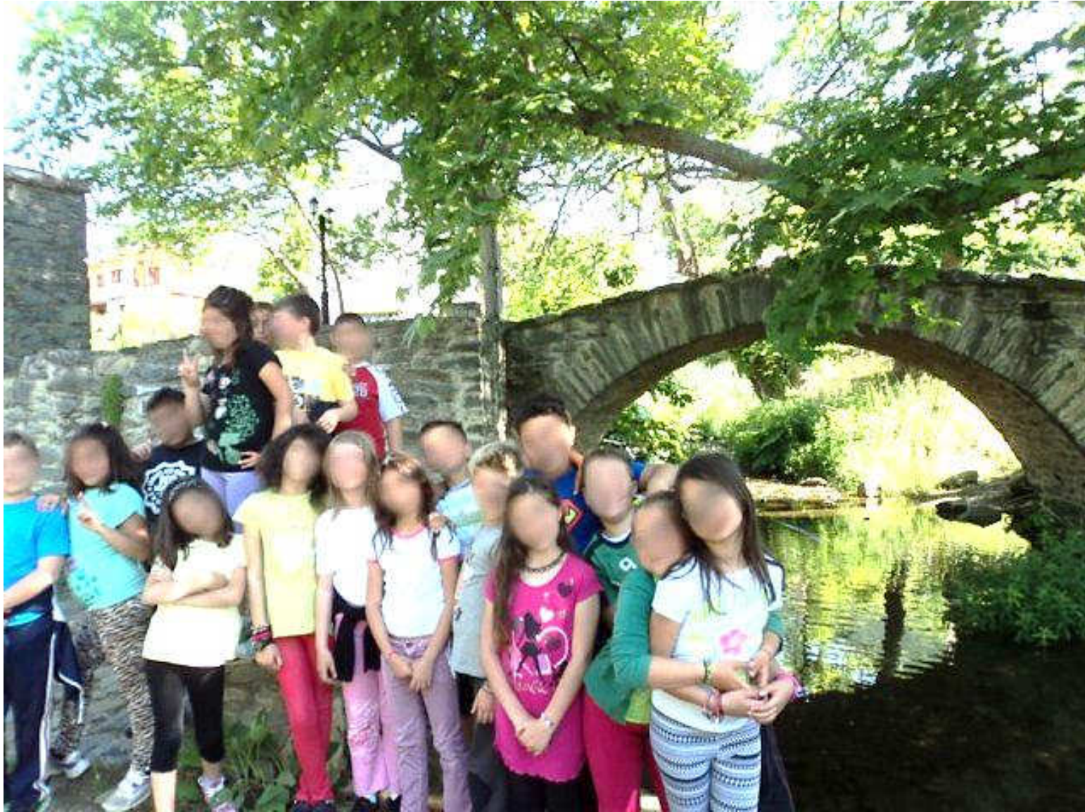
Επίσκεψη στο πέτρινο γεφύρι