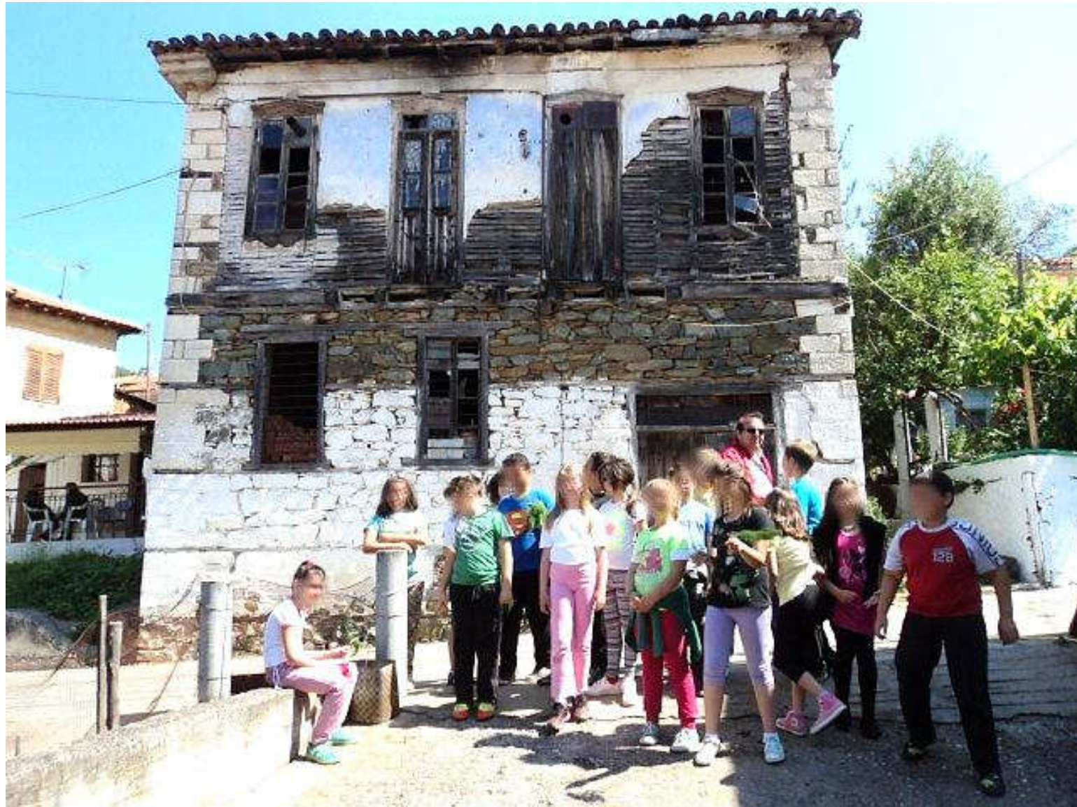
Από την επίσκεψη στον παραδοσιακό οικισμό