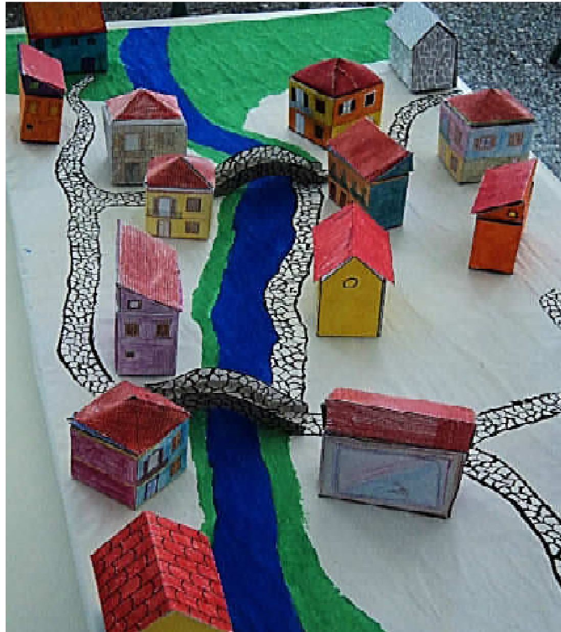
Η μακέτα παραδοσιακού οικισμού