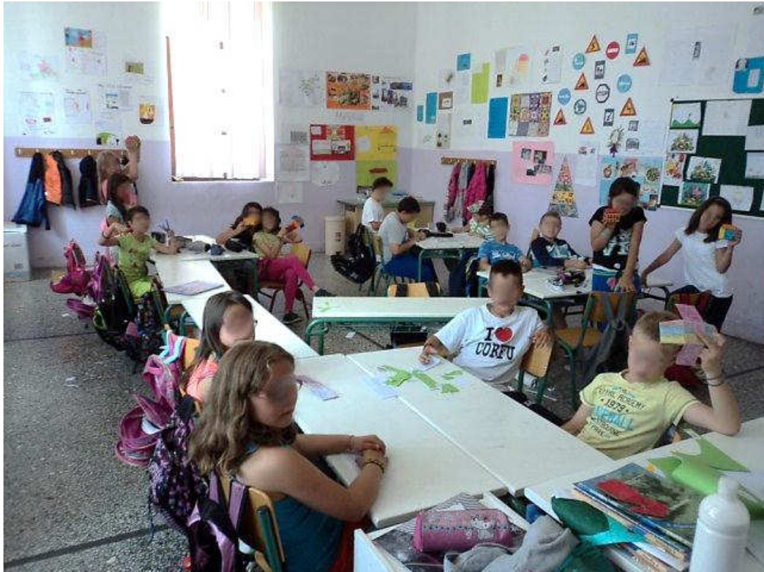
Τα παιδιά σε ομάδες κατασκευάζουν σπίτια με χαρτόνι