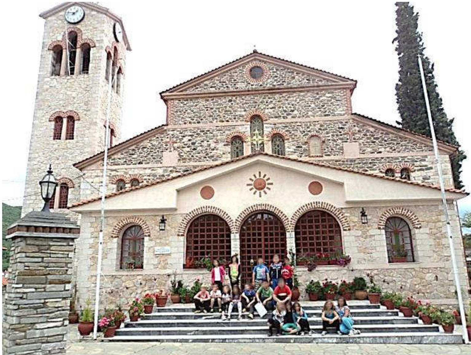
Μπροστά στην εκκλησία του χωριού